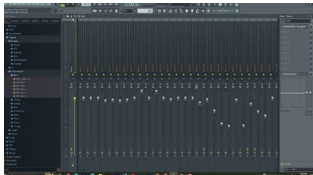
Gambar 11. Tahapan terakhir yaitu Mixing FL Studio (sumber: Olahan Penulis)

Penggabungan dari beberapa instrumen yang sudah di buat mulai dari ketukan tifa, tempo dari pijakan kaki yang membuat kestabilan dalam tempo dan juga ada progresi nada dan kunci kunci chord yang sudah di sesuaikan dengan penyesuaian nada masyarakat Tehit.