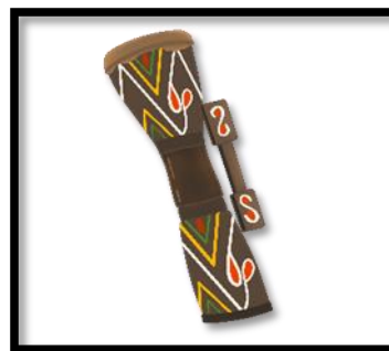
Gambar 5. Motif alat musik Triton

Revitalisasi musik tradisional Suku Tehit tidak hanya berfungsi untuk melestarikan warisan budaya, tetapi juga memperkuat identitas lokal di tengah perubahan sosial. Melalui revitalisasi, nilai-nilai lokal yang terkandung dalam musik tradisional dapat terus diwariskan kepada generasi mendatang, sekaligus memperkaya khazanah budaya Indonesia secara keseluruhan.