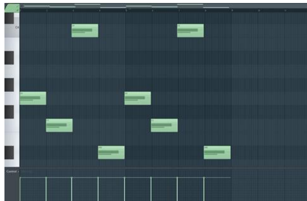
Gambar 9. Pogres Penentuan nada di track FL Studio

Dalam gambar 10 terlihat ada beberapa chanel untuk setiap instrument instrumen yang akan di gabungkan untuk menjadi suatu instrument yang baru. Dalam proses pembuatan musik baru telah di perpadukan alat musik tradisional suku tehit yaitu Tifa dengan alat musik pukul lainnya sehingga menghasilkan bunyi ketukan yang serasi dengan pijakan kaki ke lantai secara berulang ulang mengikuti tempo.