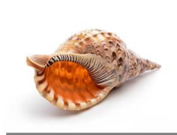
Gambar 2. Alat Musik Triton.

Triton adalah alat musik tiup tradisional Papua yang terbuat dari kulit kerang (bia). Awalnya digunakan sebagai alat komunikasi atau pemberi tanda di masyarakat pesisir Papua, terutama di Biak, Yapen, Waropen, Nabire, dan Wondama. Sekarang, triton juga digunakan sebagai alat musik pengiring hiburan dan upacara adat (Daniswari, D., 2023).