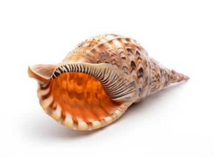
Gambar 4. Motif alat musik Triton

Motif suku Tehit memiliki makna budaya yang mendalam dan terkait erat dengan identitas serta kehidupan sosial masyarakat Tehit di Papua Barat. Salah satu motif yang penting adalah koba-koba, yang berbentuk seperti payung untuk melindungi tubuh dari panas dan hujan. Koba-koba dibuat dari daun pohon pandan hutan yang dijahit dengan pola tertentu, dan proses pembuatannya melibatkan kerja sama antara laki-laki dan perempuan, di mana perempuan memiliki peran utama dalam menjahit karena keterampilan yang diwariskan secara turun-temurun. Motif ini bukan hanya berfungsi sebagai alat pelindung, tetapi juga sebagai simbol budaya yang menjadi identitas masyarakat suku Tehit. Selain itu, koba-koba juga memiliki makna religius karena melambangkan hubungan antara manusia dengan kekuatan transenden yang mengatur alam semesta, sehingga pemanfaatan sumber daya alam dalam pembuatan motif ini menghidupkan memori budaya dan spiritual masyarakat Tehit. Secara umum, motif-motif pada suku Tehit dipengaruhi oleh kepercayaan dan adat istiadat yang mengandung unsur simbolik dan ritual, mencerminkan hubungan antara manusia, alam, dan dunia roh dalam kehidupan sehari-hari mereka.