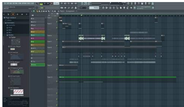
Gambar 8. Chanel track FL Studio

Dalam gambar 10 terlihat ada beberapa chanel untuk setiap instrument instrumen yang akan di gabungkan untuk menjadi suatu instrument yang baru. Dalam proses pembuatan musik baru telah di perpadukan alat musik tradisional suku tehit yaitu Tifa dengan alat musik pukul lainnya sehingga menghasilkan bunyi ketukan yang serasi dengan pijakan kaki ke lantai secara berulang ulang mengikuti tempo.