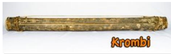
Gambar 3. Alat Musik Krombi.

Krombi adalah alat musik yang terbuat dari bambu. Di mainkan dengan cara mengetuk bambu menggunakan kayu kecil. Sebagai alat musik pengiring tarian pada pesta adat, khususnya oleh Suku Tehit di Papua Barat alat Krombi menjadi pilighan utama sebagai pengiring lagu lagu tarian suku tehit (Daniswari, D., 2023).