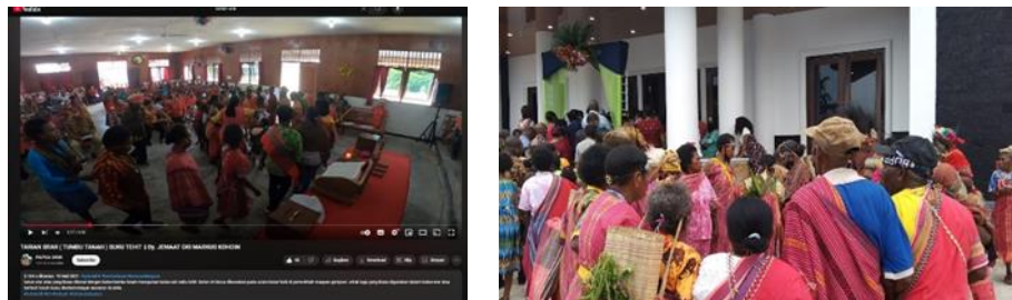
Gambar 6. Video tari Srar oleh Suku Tehit

Makna Keseluruhan: Ini adalah luapan emosi iman. Setelah merenungkan Firman, memuliakan nama Tuhan, dan mengingat sejarah iman, jemaat mencapai puncak sukacita. "Surela!" adalah ekspresi kemenangan Kristus yang dirayakan dengan seluruh budaya dan semangat mereka.