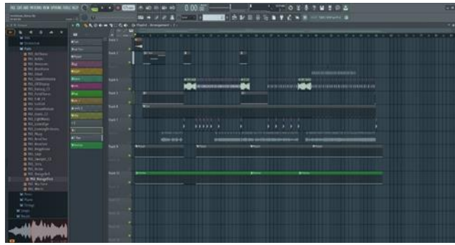
Gambar 10. Pogram penggabungan beberapa instrument di track FL Studio

Penggabungan dari beberapa instrumen yang sudah di buat mulai dari ketukan tifa, tempo dari pijakan kaki yang membuat kestabilan dalam tempo dan juga ada progresi nada dan kunci kunci chord yang sudah di sesuaikan dengan penyesuaian nada masyarakat Tehit.