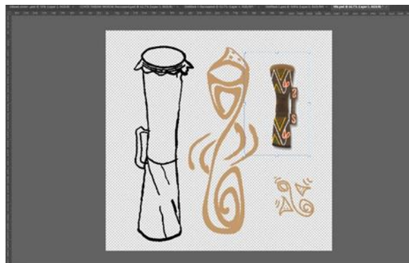
Gambar 13. Proses pembuatan motif Visualizer

Dari tabel di atas dapat disimpulkan suku tehit memiliki alat musik tradisional pertama ialah tifa yang selalu menjadi bagian utama dalam kegiatan kebudayaan tari menari dalam kegiatan budaya. Dengan adanya huruf S di setiap badan badan tifa menjadi ciri khas sebagai motif utama papua untuk mengekspresikan bentuk dari budaya. Motif yang di rancang nantinya akan di pakai ke dalam media digital seperti audio Spektrum ( Visualizer ). Dengan Proses perancangan Visualiser dengan Memakai Motif yang sudah di dapat dari analisa musik dan budaya dari suku Tehit.