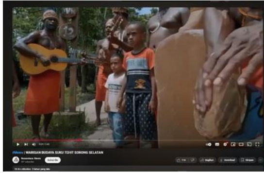
Gambar 7. Video Nyanyian Slawa oleh suku Tehit