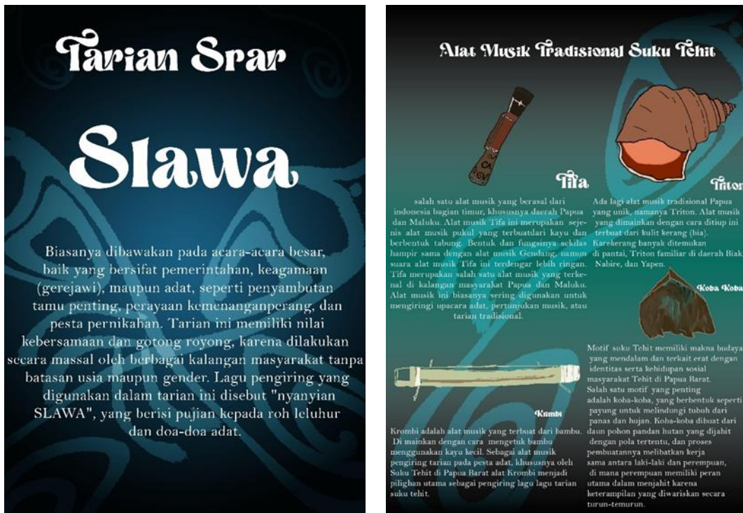
Gambar 14. Tampilan poster infografis

Proses desain Cover art menggunakan software adobe photoshop dengan memakai elemen elemen yang sudah dibuat sebagai reverensi pembuatan motif yang akan digunakan dalam Visualizer.