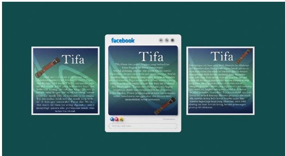
Gambar 16. Tampilan pada Media Pendukung Facebook