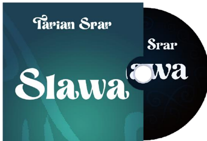
Gambar 17. Foto sampul CD Hasil Media pendukung