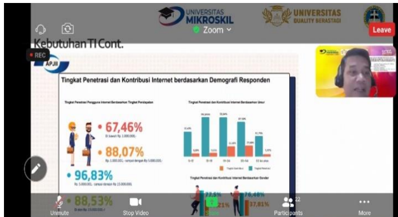
Gambar. 2. Pelaksanaan Kegiatan Pengabdian kepada Masyarakat Secara Daring

Kegiatan pengabdian ini dirancang agar peserta mendapatkan pemahaman terhadap konsep teknologi informasi, dan dilanjutkan dengan pembahasan mengenai dampak positif dan negatif dari teknologi informasi, serta pemanfaatan teknologi informasi dalam kegiatan ekonomi digital. Dengan begitu diharapkan muda-mudi GBKP Darussalam dapat mengendalikan penggunaan teknologi dalam kehidupan sehari-hari untuk meningkatkan kreatifitas dan inovasi mereka. Implementasi dalam keseharian dijelaskan secara komprehensif dalam pelatihan ini dan disertakan contoh, serta dilakukan dengan komunikasi dua arah antara peserta dan presenter sehingga peserta seminar dapat memahami fakta dari fenomena yang terjadi di kehidupan masyarakat pada saat ini terkait ekonomi digital.