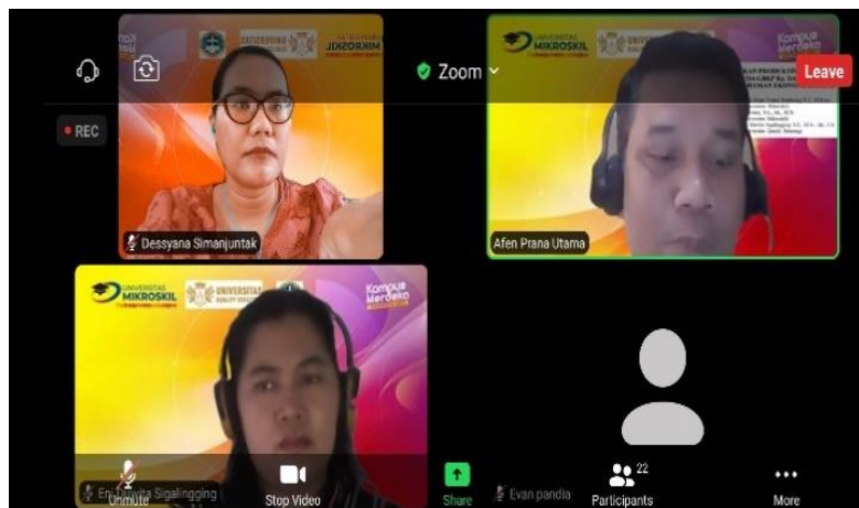
Gambar 3. Tim Dosen Pelaksana Kegiatan

Kegiatan sudah berlangsung selama 2 (dua) bulan lebih sejak dari identifikasi situasi mitra sampai dengan laporan kemajuan. Pelaksanaan seminar sudah dilaksanakan hari minggu, 26 Juni 2022 pukul 14.00 Wib menggunakan media zoom. Kegiatan ini diikuti oleh 23 peserta. Peserta diminta mengisi link absensi dan pre-test sebelum kegiatan dimulai untuk mengukur pemahaman awal dari peserta. Selama kegiatan berlangsung terdapat 4 (empat) peserta yang memberikan pertanyaan kepada penyaji mengenai teknologi dan ekonomi digital. Sebelum kegiatan berakhir, peserta diminta mengisi kembali link post-test yang disediakan. Dari hasil jawaban peserta terdapat peningkatan pemahaman peserta mengenai materi yang dibawakan.