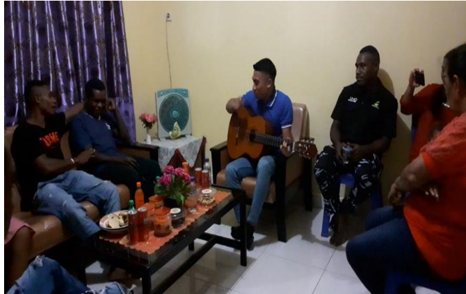
Gambar 3. Pembinaan Rohani