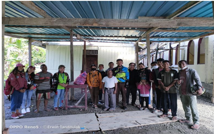
Gambar 1. Masyarakat Kampung Botawa

Sasaran utama kegiatan ini adalah kepala keluarga di Kampung Botawa yang rumahnya berjauhan dengan gereja dan memiliki keterbatasan ekonomi. Pada hari pelaksanaan, kegiatan dihadiri oleh tim Komunitas Suara Kebenaran GBI COP serta kepala kampung Botawa yang turut serta mendampingi seluruh rangkaian acara. Kehadiran kepala kampung ini memperkuat legitimasi sosial kegiatan di mata warga dan menjadi faktor penting dalam keberhasilan mobilisasi partisipasi masyarakat, mengingat peran tokoh adat dan tokoh masyarakat sangat menentukan tingkat kepercayaan warga pedalaman terhadap pihak luar yang datang melayani.