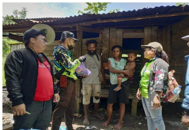
Gambar 2. Pembagian Paket Sembako

Target kegiatan berupa pembagian paket sembako kepada keluarga kurang mampu serta pelaksanaan bimbingan rohani berhasil dilaksanakan sesuai rencana. Partisipasi dan antusiasme warga selama kegiatan berlangsung menjadi indikator bahwa target kuantitatif dan kualitatif kegiatan tercapai. Masyarakat menyambut kegiatan ini dengan penuh sukacita, sebagaimana tercermin dari keterlibatan aktif mereka dalam setiap sesi, mulai dari ibadah, pendalaman Alkitab, hingga proses pengambilan paket sembako yang berjalan tertib berkat koordinasi yang baik antara tim pelaksana dan tokoh masyarakat setempat.